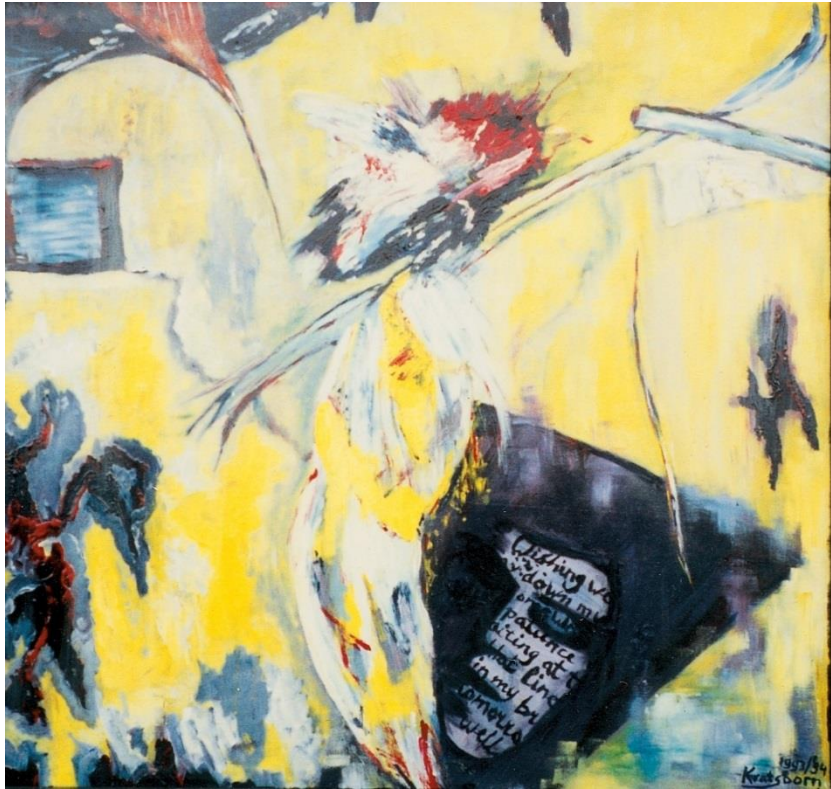
'La condition humaine', Wim Kratsborn 1992 (inclusief de song 'Passenger in Time')