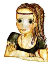
CHillak: alternatieve jongere uit Ljubljana