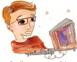
Sandis: avatar en Putinist uit Riga