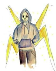
Django: jihadist uit Londen